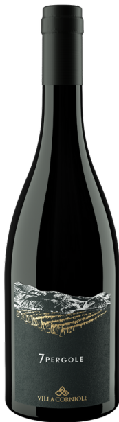
7 PERGOLE TEROLDEGO