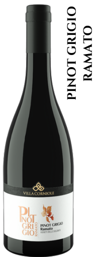
PINOT GRIGIO RAMATO